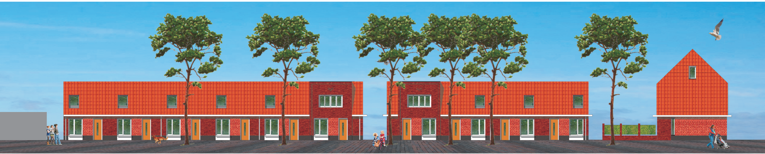
Blok 1, type A