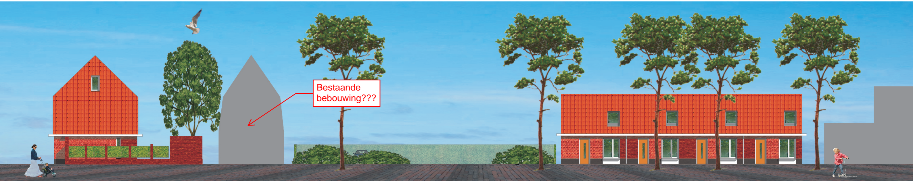
Blok 6, type B